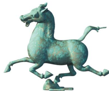
答案：“马踏飞燕”（或“马超龙雀”）

55. 1969 年出土于中国甘肃省武威县的青铜器_____，是中国青铜艺术的奇葩，现在已成为中国旅游的标志。